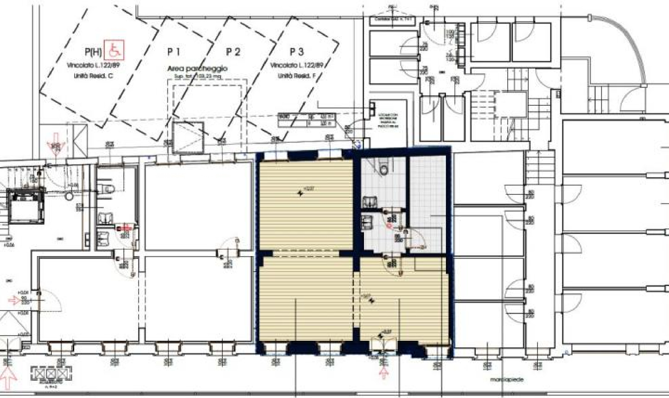
Unità B - Piano Terra