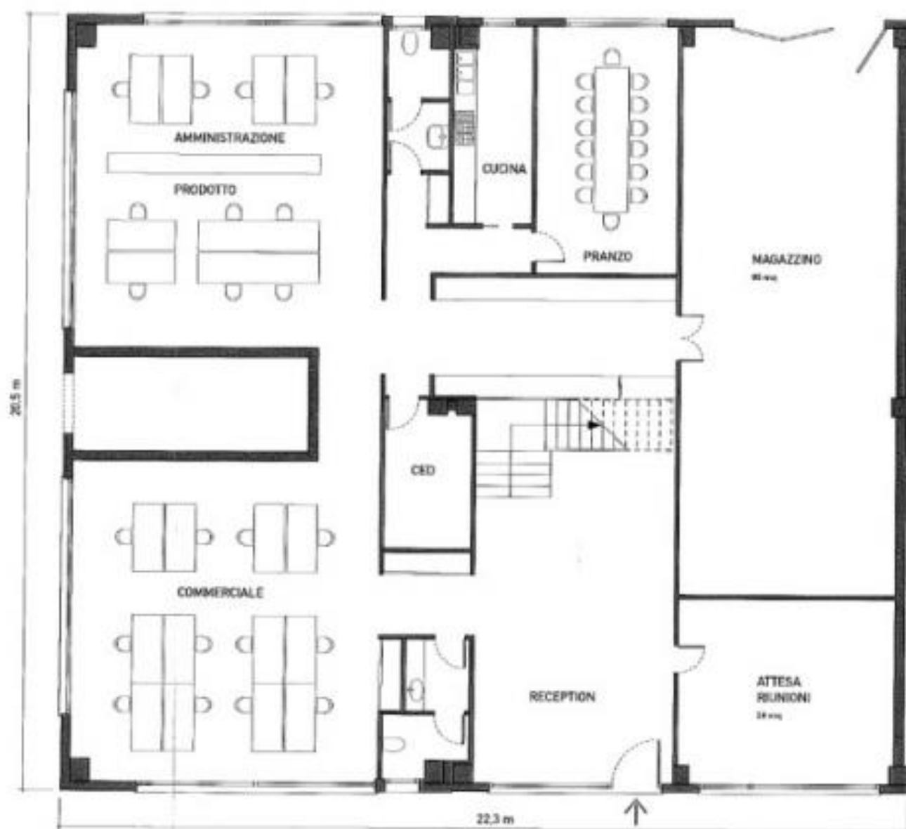
Piano Terra 1:100